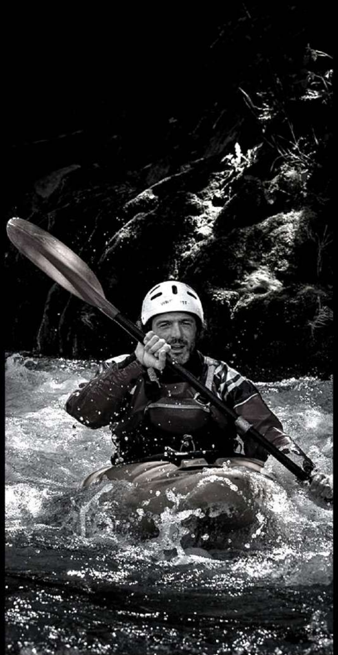
Moniteur Canyon l'été en tant que travailleur indépendant