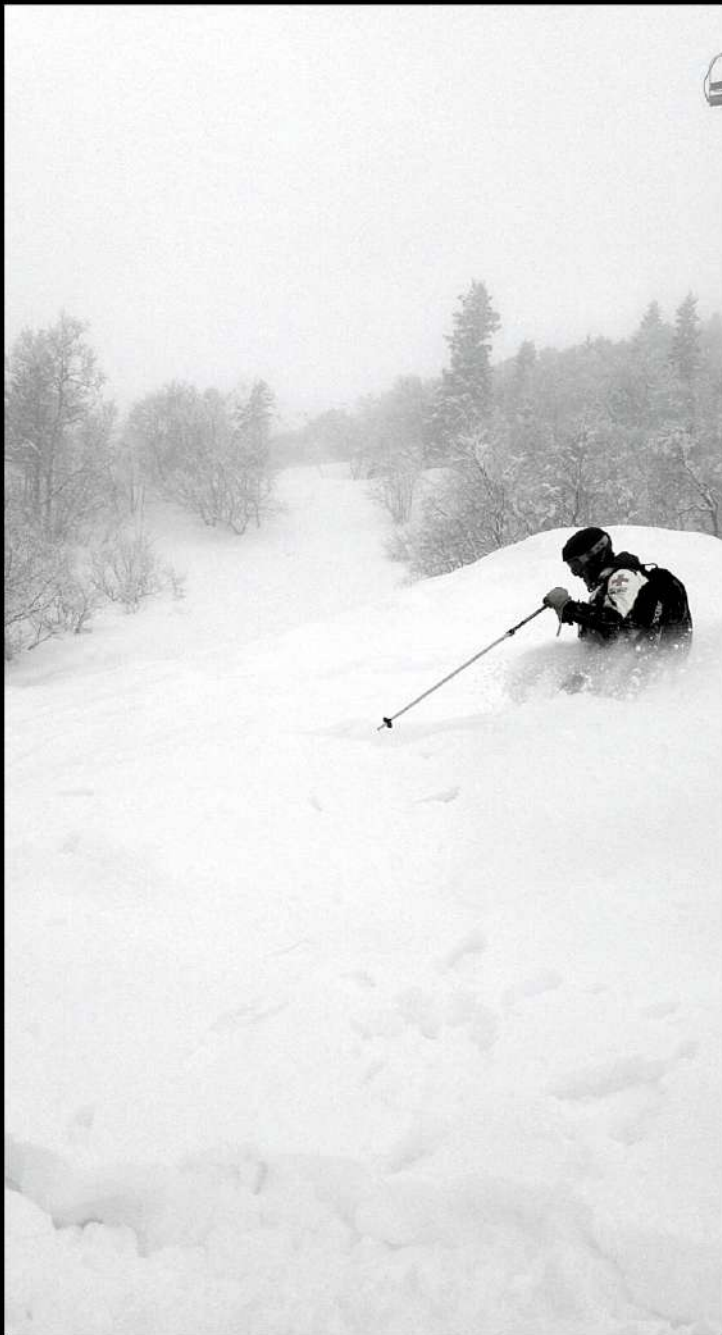
Pisteur Secouriste l'hiver en station de ski