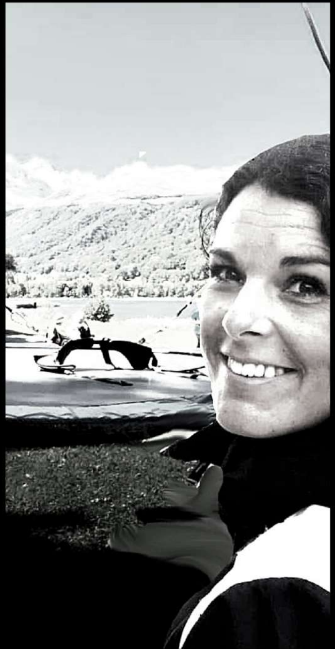
Animatrice sportive et ludique l'été