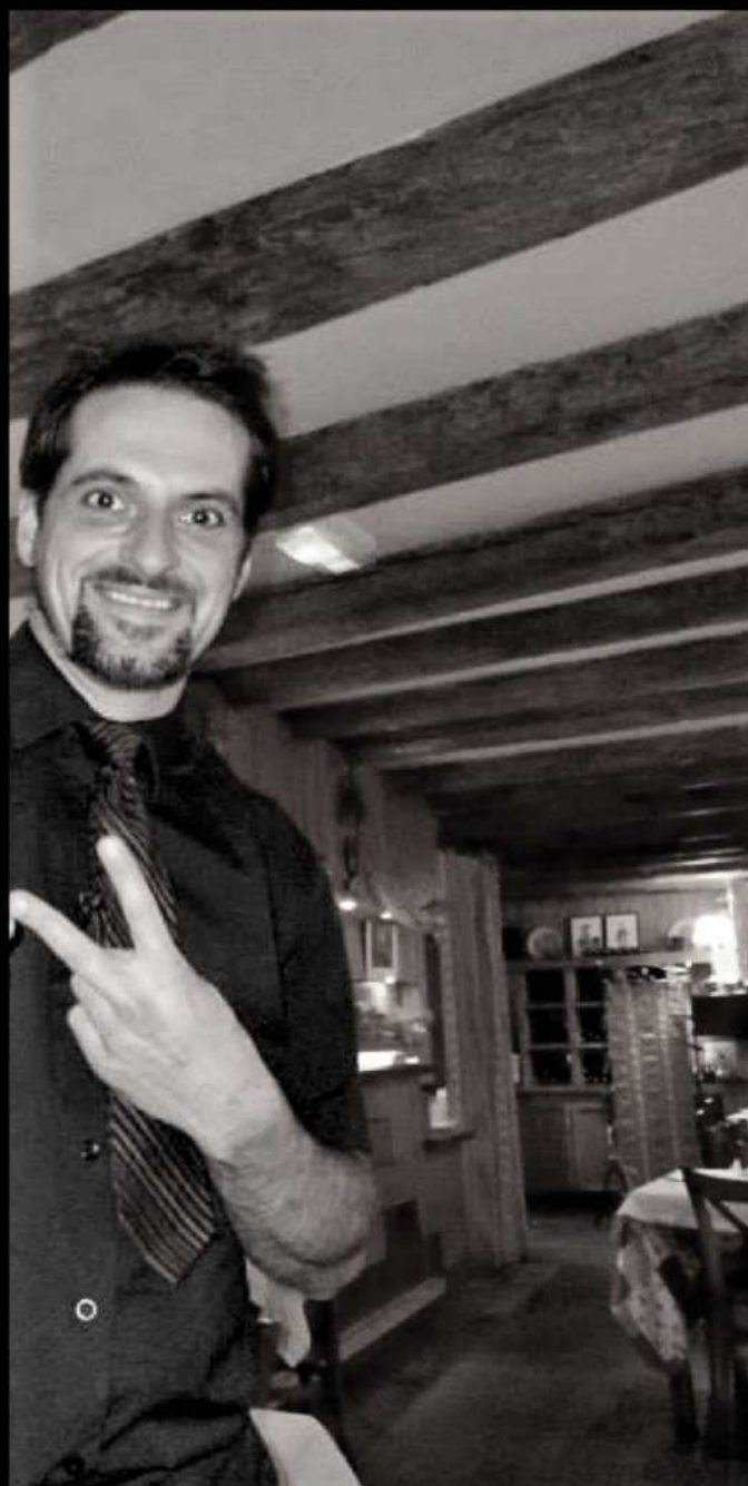
Serveur l'été dans un restaurant