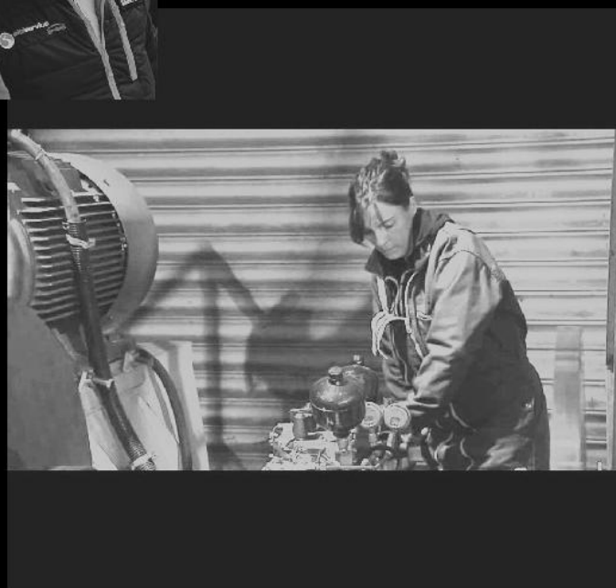
Dameur l'hiver en station de ski et Berger l'été