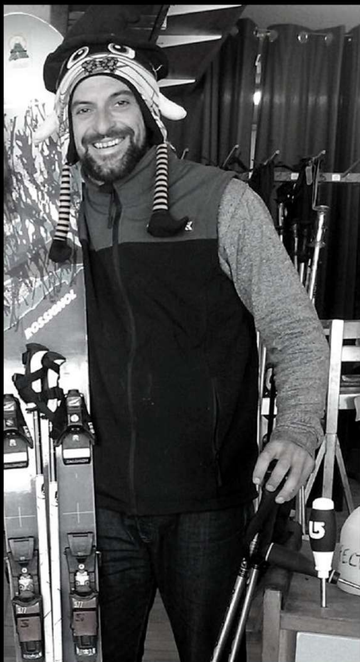
Vendeur Technicien Ski l'hiver