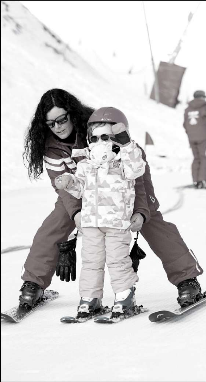
Monitrice de ski l'hiver